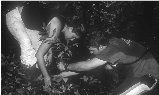
Hauptarbeit beim Pflanzen ist meist, den Platz für das neue Bäumchen freizulegen.

Zwei Trends setzen den Wäldern weltweit zu: die Übernutzung oder Abholzung sowie die direkte Umwandlung in Plantagen mit dem Ziel, Papier, Soja oder Palmöl zu gewinnen. Für die Ökosysteme, speziell die Artenvielfalt, sind dies einschneidende Veränderungen, wie am Beispiel Sumatra auf den Seiten 2 und 3 beschrieben wird. Auch die Menschen, die in diesen zerstörten Regionen leben, leiden unter den veränderten Bedingungen. Ein intakter Wald liefert der Bevölkerung mehr als nur Holz oder Palmöl. Gegen diese frustrierende Dynamik sollen die von uns unterstützten Baumpflanzprojekte Zeichen setzen.