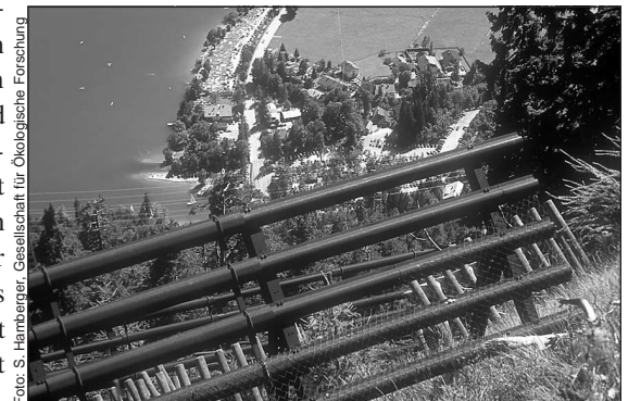
Wo der Wald fehlt oder geschwächt ist, werden mit hohem finanziellem Aufwand Verbauungen angebracht. Sie müssen Schutzfunktionen übernehmen, die früher der Wald gratis bereitstellte.

Der Wald dient nicht nur der Produktion von Holz oder als Kulisse für die Trophäenjagd. Er ist unersetzbar für die Erholung der Bürger, den Lärmschutz, er sorgt für sauberes Trinkwasser, frische Luft, Schutz vor Hochwasser, Lawinen und Erdbeben und ist Lebens-