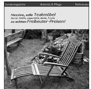
Ohne Rücksicht auf Verluste

Derzeit gibt es keine gesetzlichen Regelungen gibt, die den Import von illegalen Raubbauhölzern verbietet. Der Handel hat über unverbindlich Absichtserklärungen hinaus nicht einmal eine Selbstverpflichtungserklärung erarbeitet oder verabschiedet. Pro REGENWALD fordert angesichts der fortschreitenden Regenwaldzerstörung von den zuständigen Ministerien wenigstens die Bereitstellung ausreichender Infomaterialien, die dem Handel und den KonsumentInnen als Entscheidungshilfe dienen könnte. Desweiteren müsste aus den Ministerien konkrete Unterstützung für die wertvolle Aufklärungsarbeit, die Umweltverbände leisten, bereitgestellt werden. Wie sonst sollte es mehr hartnäckige, gut informierte und streiterprobt KonsumentInnen geben?