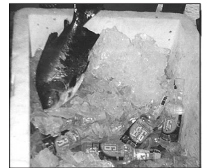
Fisch und Schnapps in Eis

Nach nur wenigen Tagen hatten die knapp einhundert Indianer am Kontrollposten mehrere Ladungen mit alkoholischen Getränken und Goldsucherausrüstungen beschlagnahmt.