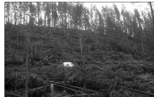
Gelegentlich beschleunigt der Sturmwurf den Umbau, doch wer will diese Methode freiwillig flächendeckend einsetzen?

Schlimmer noch sind die Folgen im Schutzwald. Ist dieser durch Wildverbiss und Luftschadstoffe geschädigt oder gar