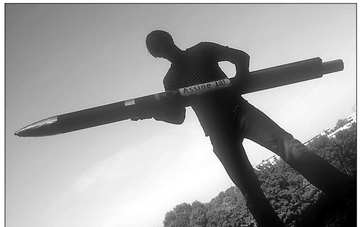
Für Pro REGENWALD-Aktivistin ist kein Weg zu weit und kein Stift zu schwer: das große Modell wollte die Brasilianische Botschaft nicht an Präsident Lula weiterleiten - wir hoffen, dass er das Landrechtsdekret dann bald mit einem kleinen Stift unterschreibt.

Montag, Plenum bei Pro REGENWALD: Kurzberichte von den aktuellen Baustellen, u.a. Uniumfrage, Vorbereitung zu Volksbegehren, Pipelinebruch in Ecuador, Meldung aus Brasilien: Die Entwaldung hat wieder zugenommen. Warum geht das alles so zäh oder gar in die falsche Richtung? Hinschmeissen und aufhören? Alles einfach geschehen lassen? Nein, dann besser doch weitermachen!