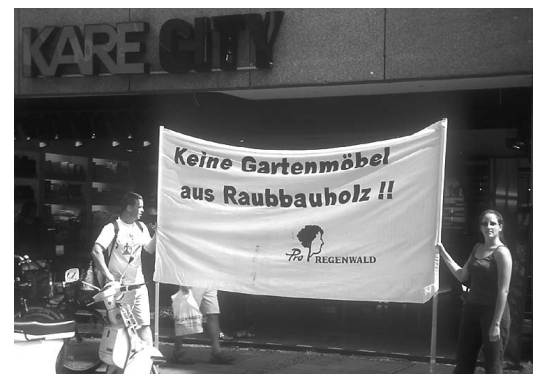
Bei Rossmann werden solche Besuche künftig nicht mehr nötig sein. Es bleibt zu hoffen, dass auch andere Unternehmen zügig raubbauholzfrei werden.

Die Zweifel, welche aufgeworfen wurden, ob die Prüfsiegel das wiedergeben, was sie versprechen.