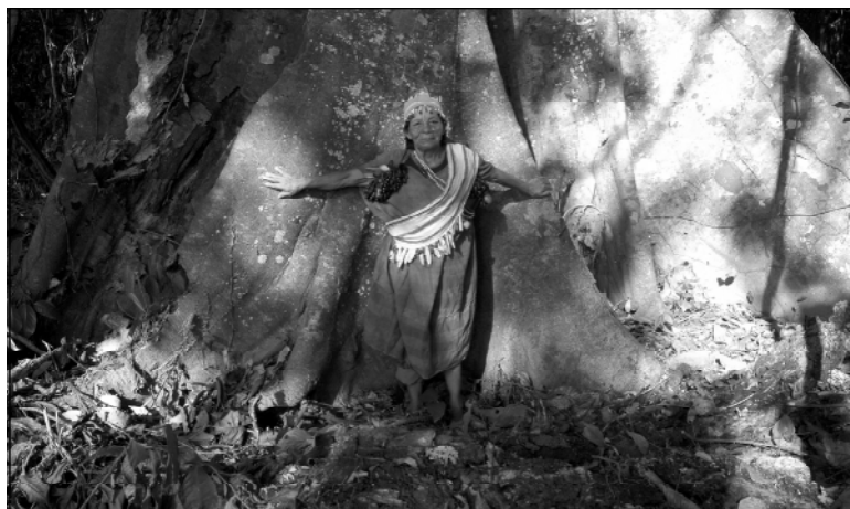
Finger weg! Der Wald gehört uns.

Angesichts der von der drohenden Ölförderung künftig zu erwartenden Probleme und in Angst um ihr Leben und die Umwelt, verabschiedeten die Vertreter der indianischen Gemeinden eine Erklärung. Darin verkündeten sie in den betroffenen indianischen Gebieten den Notstand, verwehren den Ölunternehmen Repsol und Burlington den Zutritt