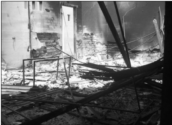
Niedergebranntes Schulgebäude der Missionsstation Surumu