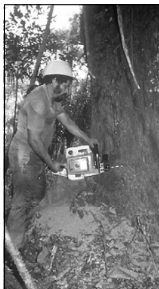
Motorsägen: Jetzt doch nicht so gut für den Wald

Dabei ist der selektive Holzeinschlag die Wunderwaffe der Holzindustrie - vor allen Dingen im Kampf gegen Umweltschützer. Die Vorstellung von einem Hektar ganz schonend nur drei oder vier Bäume zu ernten, hat auch manchen Regenwaldschützer verstummen lassen. Zumal Holzfirmen mit Fotos von Holzurückewegen, einige Jahre nach dem Eingriff aufgenommen, dokumentieren konnten, wie schnell die Wunden im Wald doch wieder geschlossen werden.