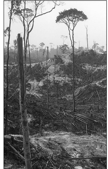
So sieht es aus, wenn Regenwald zur Plantage wird.

Wir wetten, dass diese Herren für weitere Waldzerstörung durch die neuen Vorhaben nicht haften werden.