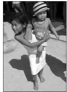
Schnell, schnell, wir wollen nicht zu spät kommen zum Fest