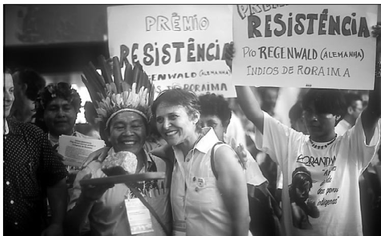
Widerstandspreis für die Organisation CIR (Conselho Indígena de Roraima) auf dem Weltsocialforum in Porto Alegre 2003

Als Luís Inacio Lula da Silva Ende 2002 zum Präsidenten Brasiliens gewählt wurde, schöpften auch die Indianervölker neuen Mut und hofften auf bessere Zeiten. Lula hatte vor seiner Wahl angekündigt, in seiner Amtszeit die Eigentumsverhältnisse der noch ausstehenden Indianergebiete zu klären. Das Indianergebiet Raposa/Serra do Sol kennt Lula von einem früheren Besuch, bei dem er versprochen hatte, sich für dessen endgültige Anerkennung einzusetzen. Doch im Amt enttäuschte Lula die von den Indianern in ihn gesetzte Hoffnungen schmäzlich. Mehrere Demonstrationen von Ureinwohnern und ab der zweiten Jahreshälfte 2004 ein Dauercamp vor dem Regierungsgebäude in Brasilia waren Ausdruck der Frustration darüber, dass die linke Regierung so wenig auf die Anliegen der Urbevölkerung einging wie die vorherigen rechtsgerichteten Administrationen. Lulas Arbeiterpartei hatte wohl beizeiten erkannt, dass mit dem Eintreten für indianische Forderungen kaum Wählerstimmen zu holen sind, mit den Anliegen landhungriger Siedler jedoch schon. Zudem verhinderten bei verschiedenen Gerichten anhängige Klagen - ein bewährtes Instrument der Gegner bei Landrechtsvergabe an Indigene - fast zweieinhalb Jahre eine Entscheidung, bis der Oberste Bundesgerichtshof Mitte April dann den Weg für die Anerkennung freigemacht und alle Klagen gegen das Indianergebiet abgewiesen hat.