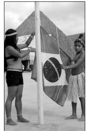
Die Indianer legen auch Wert auf Feiertagsbeflaggung

Den italienischen Missionaren verdanken die Macuxi und ihre Nachbarvölker viel. Heute gehören sie zu den am besten organisierten und - für brasilianische Verhältnisse selten - nicht korruptierten Indianern im Land. Rückblickend war ihr Entschluss, kollektiv auf den Konsum von Alkohol zu verzichten, der Auftakt für den Befreiungskampf. Schritt für Schritt besetzten sie danach wieder all ihre traditionellen Lebensräume, dokumentierten dies mit dem Bau zahlreicher Dörfer und vor allem mit der Viehzucht. Basierend auf der Idee, ebenso wie die weißen Eindringlinge den An-