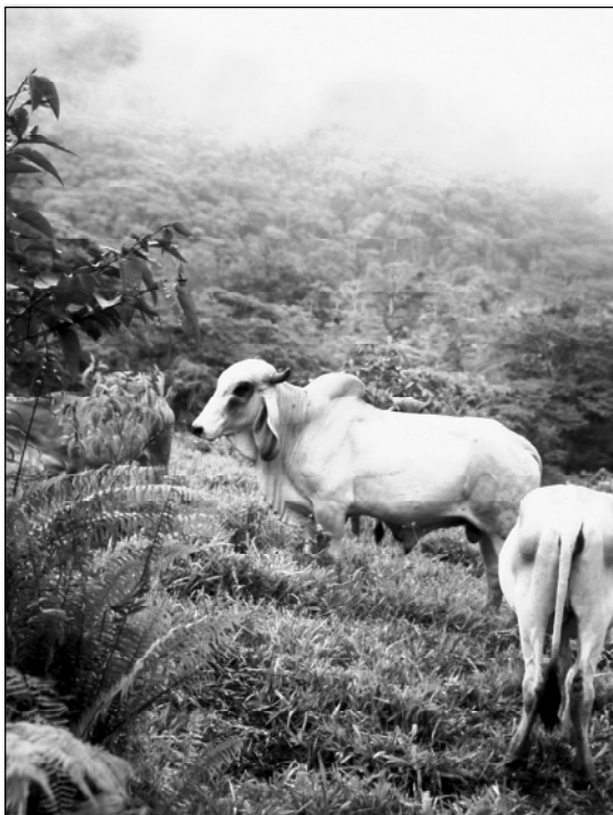
Wo Rinder sind ist Regenwaldzerstörung und Erosion.

Die Station ist von einem "Schlangenzaun" geschützt, um giftige Schlangen