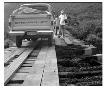
Als Schikaneaktion haben Indianergegner diese Brücke zerstört, die man nach einer notdürftigen Reparatur erst wieder nutzen konnte.

Anmerkung Pro REGENWALD : Forró und Parichara sind Musik/Tanzstile, Cachirí ist ein fermentiertes Cassavagetränk (Maniok)