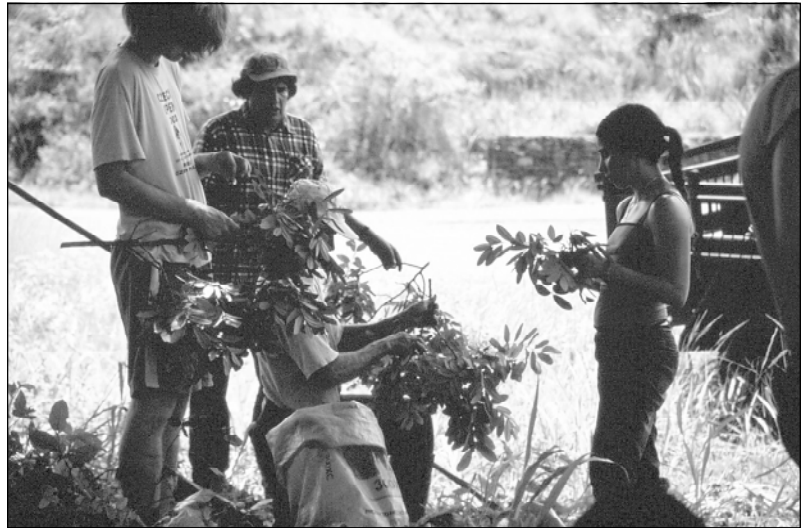
Samensammeln: Oft fährt man weite Strecken, bis man einen geeigneten Baum findet.

Der "Alltag" auf der Station erlaubt auch einige Ausflüge und Wanderungen. So können wir eine Mitfahrgelegenheit auf den Berg "La Potenciana" (ca. 1600 m) nutzen. Wir sind in den Wolken und spazieren durch verschiedenste Wald-/Vegetationszonen hinab ins Tal. Der Wald wird immer wieder von Kaffeepflanzungen oder Viehweiden unterbrochen. Die Kühe weiden in Steilhängen und wir sehen die Erosion, die dem Vieh folgt. Hier und da hat jemand versucht, seine Rinderweide zu vergrößern, einige Bäume des angrenzenden Waldes werden einfach umgesägt und liegen noch im Hang. So kann "Landgewinnung" auch laufen, unserer Führer erzählt uns, dass es eigentlich verboten ist.