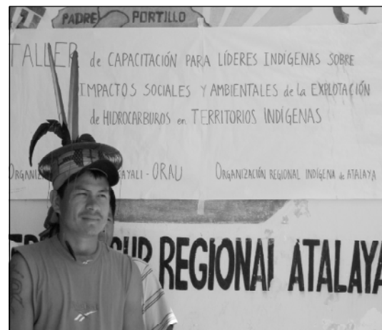
Es gab wenig Erfreuliches zu hören auf dem Workshop. Umso entschlossener sind die Indianer gegen das Ölgeschäft.

Der Workshop war für die einladenden Organisationen ORAU und OIRA und die indianischen Führer ein erster Schritt gegen die Zerstörung ihres Waldes durch die Ölwirtschaft. Sie wissen, dass der Kampf damit nicht vorbei ist. Pro REGENWALD wird sie dabei weiter begleiten und unterstützen.