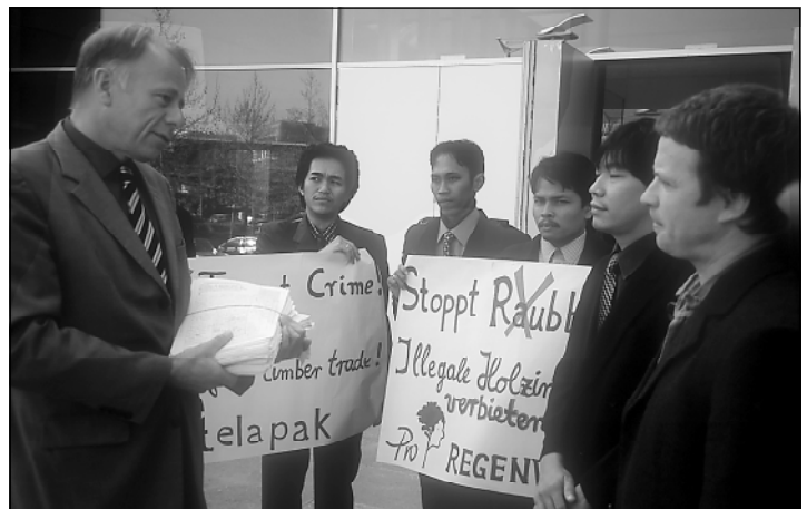
Interessierter und engagierter Regenwaldschützer, Ex-Minister Jürgen Trittin. Unglücklicherweise mit reduzierter Dienstzeit wg. Schröder (siehe Seite 16)