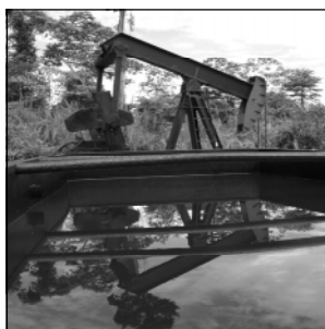
Wer will soetwas in seinem Garten haben - Ölförderung?