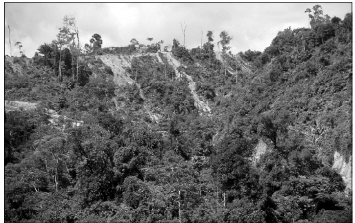
Durch Holzeinschlag stark in Mitleidenschaft gezogener Wald in Sarawak, Malaysia. Nach unserem Verständnis doppelt illegal: Erstens erheben Ureinwohner Anspruch auf den Wald und sind gegen die Holzfällerei und zweitens werden Vorschriften zur Ausübung nachhaltiger Waldwirtschaft nicht eingehalten - Folge ist seine Zerstörung.

kommt. Seit Jahren verspricht der GDH eine Selbstverpflichtungserklärung, der sich dann alle Mitgliedsunternehmen unterwerfen würden. Den Unternehmen, die seit Jahren jede Kritik abprallen lassen und ihre Geschäfte auf Kosten des Regenwaldes weitermachen, scheint der Erhalt der Wälder noch nicht wichtig