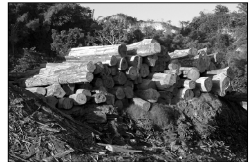
Illegal geerntete Stämme warten auf den Weitertransport. Contamana, Peru

(siehe Seite 4). Durch den Einschlag in geschützten Gebieten (wie etwa Nationalparks) oder das Überschreiten der Einschlagsquote, durch die Verarbeitung der Stämme ohne Erwerb einer Lizenz und durch den Export der Produkte ohne Zahlung von Exportzöllen, können Unternehmen einen sehr viel größeren Gewinn erwirtschaften, als wenn sie sich an geltendes Recht halten würden. Das Ausmaß des illegalen Holzeinschlags ist in manchen Ländern so groß, und die Strafverfolgung so dürftig, dass die Gefahr einer Entdeckung und Verurteilung sehr gering ist. Entsprechend groß ist der Anreiz, sich durch illegale Praktiken zu bereichern.