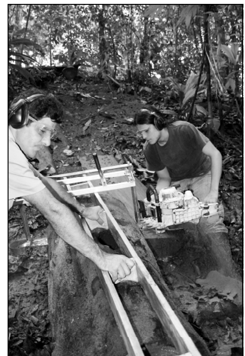
Waldzerstörer, nachhaltige Holzernte ist arbeitsintensiv und wirft weniger Profit ab, als viele der üblichen 'grap-and-run'-Operationen aus denen manches Holz stammt.