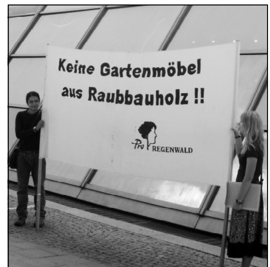
Keiner will es eigentlich, doch der Handel will es nicht zur Gewissheit aller aus dem Angebot nehmen.

Es gibt viele Arten von illegalen Aktivitäten. In den meisten Fällen dienen sie der Bereicherung weniger am Geschäft beteiligter Akteure. Gemeinsam ist all diesen Raubbauaktivitäten, dass sie sowohl das Ökosystem schädigen als auch die regionale Bevölkerung um Einkommensmöglichkeiten betrügen. Was sich in der Liste auf der folgenden Seite langwierig liest, ist vor Ort in Wirklichkeit Stoff für die Drehbücher mehrerer spannender Ökokrimis.