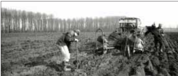
Hier wird ein Kohlenstoff-Acker bestellt: Bäume pflanzen um CO 2 zu binden

Das Pflanzen von Bäumen ist nicht zwangsläufig gut für die Umwelt und die Menschen. Von den meisten der bisher angelegten CO 2 -Plantagen sind schon jetzt nach nur wenigen Jahren enorme soziale und ökologische Begleiterscheinungen bekannt geworden.