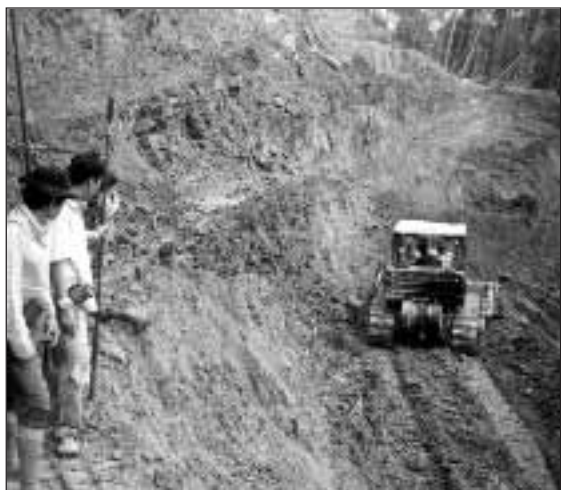
Die Einheimischen beobachten, wie eine Planierraupe der Firma Ravenscourt (Samling) einen Hang für eine Holztransportstraße zerschneidet und ärgern sich darüber, daß danach durch die Erosion die Flüsse verschmutzen

Die kürzlich veröffentlichte Studie 'Not Development, but Theft' zeigt, was die Penan erlebt haben und selbst denken. Mitarbeiter der malaysischen Organisation Ideal (Institute for Development and Alternative Living) haben die Bewohner von 15 Penan-Dörfern befragt, zuerst 1995 und dann noch einmal 1999.