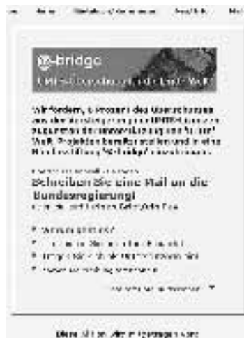
UMTS-AktionSite zum Mitmachen: http://www.wald.org/umts

Wir fordern Solidarität und 'Über-den-eigenen-Tellerrand-hinaussehen' auch und gerade in wirtschaftlich angeblich schwierigen Zeiten. Bitte unterstützen Sie diese Aktionen - helfen Sie mit, Solidarität und Weitsicht zu fördern.