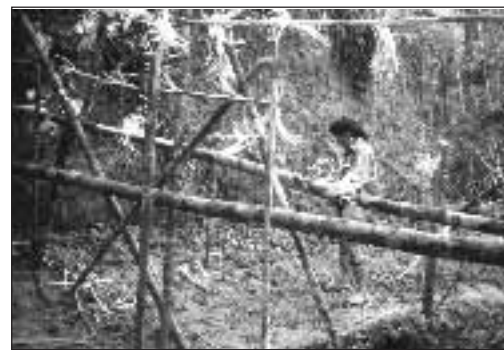
Bau einer Blockade

ten unzufrieden. Die Autoren der Studie fassen die Antworten zu diesem Thema zusammen: "Die Regierung behauptet, sie gebe immer mehr Geld für die Penan aus. Aber das Ergebnis dieser Umfrage zeigt: Vor Ort ist wenig davon zu sehen. Wir würden gerne wissen, in welche Taschen die versprochenen Mittel geflossen sind".