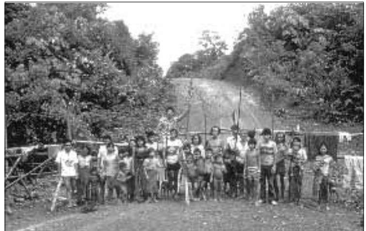
Eine der typischen Blockaden, wie sie in Sarawak jetzt wieder vermehrt errichtet werden. Selbst wenn sie einfach aussehen, solange die Anwohner dabeistehen, werden die Barrikaden respektiert und die Ureinwohner können den Holzeinschlag für Monate stilllegen.