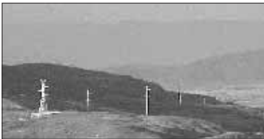
Die Trasse schiebt sich weit sichtbar durch den Wald

Inzwischen ist alles wieder anders. Offensichtlich hat Chavez auch den Vertretern der mächtigen Industrie- und Bergbaukonzerne einiges versprochen und steht jetzt schwer unter Druck: Nach dem Willen der mächtigen Corporación Venezolana de Guayana (CVG) sollen die Bodenschätze im Südosten Venezuelas ausgebeutet werden. Die CVG ist im Besitz des Staates und vereinigt 37 Konzerne aus der Eisen- und Stahlindustrie, Stromversorgern, Bergbau, Holzfirmen, Agrarkonzerne und Baufirmen.