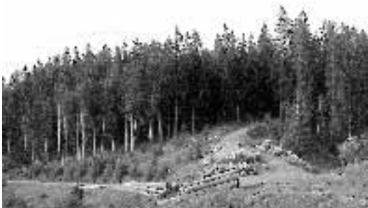
Fichtenforst in Deutschland, den Forstleute gerne als Wald bezeichnen. In anderen Ländern wär's eine Plantage

Grundlage für die Erarbeitung Nationaler Waldprogramme (NWP) sind die Handlungsempfehlungen, die 1997 vom Zwischenstaatlichen Waldausschuß der Vereinten Nationen (IPF) verabschiedet wurden. NWP sollen darlegen, wie Staaten mit ihren Wäldern umgehen wollen,