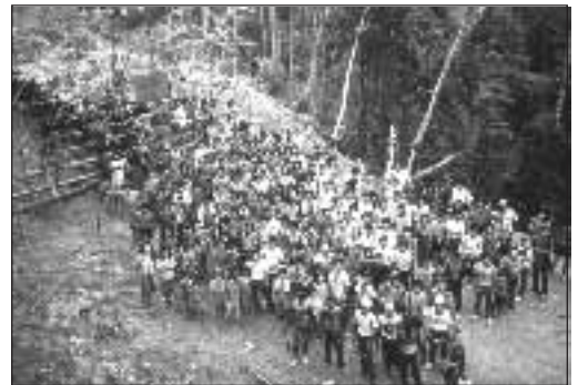
Blockaden sind die letzte Instanz für die Einheimischen

Um den Dauerkonflikt mit den Waldnomaden zu lösen, hat man eine perfide Strategie erdacht. Nach dem Willen des Chief Ministers sollen die Penan endlich ihre rückständige und armselige Existenz aufgeben und sich in die malaysische Gesellschaft integrieren, d.h. Pässe beantragen und sesshaft werden. Der Grund dafür liegt klar auf der Hand: Hat man die Menschen erst einmal ent-